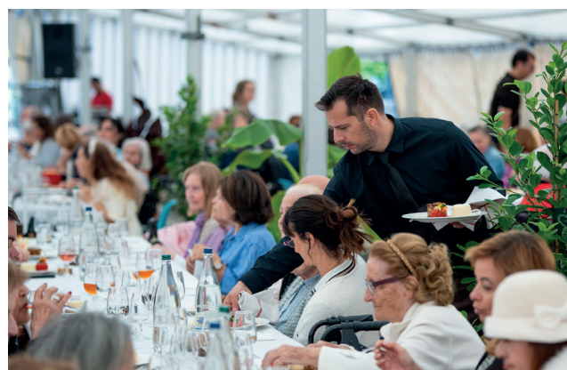
Déjeuner printanier des aînés