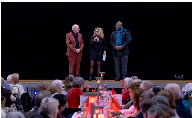
Conseil administratif du Grand-Saconnex

Le rendez-vous est d'ores et déjà pris pour l'année prochaine à la salle du Pommier, mieux chauffée, c'est promis !