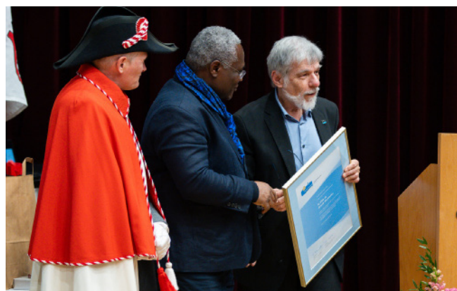
Présentation du label Cité de l'Energie Gold