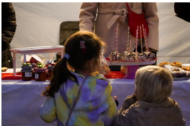
Marché de Noël à la patinoire