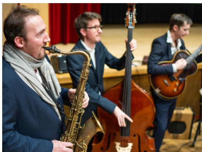
Sunny Side Trio