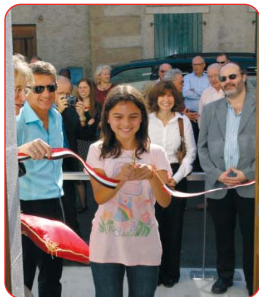
Couverture : inauguration de l'Ancienne Mairie