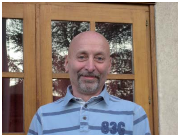
2012, devant la salle communale des Délices