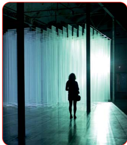
Couverture : festival ANTIGEL